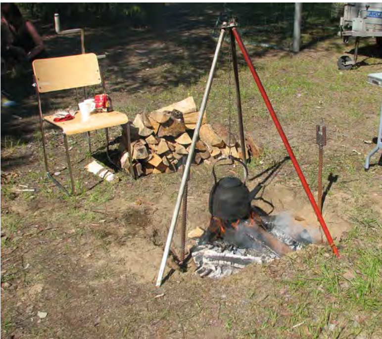
Liite 1: A-kiltatoiminnan tunnuslukuja

A-Kiltojen Liitto ry:n keskus toimisto sijaitsee Tampereella, aluetoimistot Oulussa ja Hyvinkäällä. A-Kiltojen Liitto ry:n varsinainen toiminta rahoitettiin pääasiassa Raha-automaattiyhdistyksen yleisavustuksella. Päihdeasiamestoimintaan saatiin RAY:n kohdennettu toiminta-avustus.